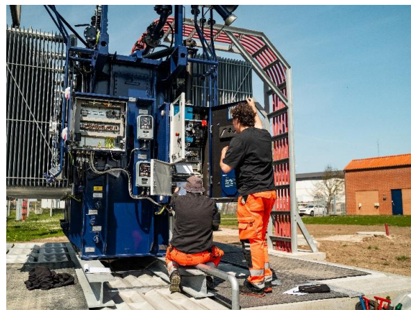
FIGUR 1 NY TRANSFORMER

For at øge leveringssikkerheden i forsyningsområdet er flere tiltag igangsat. Over en årrække udskiftes eller suppleres antallet af 60/10 kV transformere i bevillingsområdet med henblik på at have mere end én transformere på hver hovedstation. I 2025 er en gammel transformere således udskiftet til en ny. Primo 2026 er der desuden leveret en ny transformere, således der fremover også vil være to transformere på yderligere en station. Udover installation og idriftsættelse af transformere og dertilhørende koblingsanlæg, har der i 2025 været fokus på vedligehold af anlæg samt reinvesteringer og forstærkninger i både høj- og lavspændingsnettet. Fejlraten på ældre oliepapir-kabler er stigende, hvorfor der de kommende år prioriteres at få udskiftet disse.